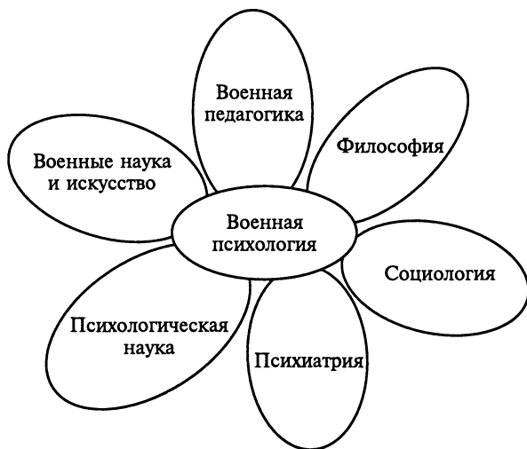
Рис. 1. Место военной психологии в системе наук

Социальная психология является для военной психологии важнейшим источником теоретических и экспериментальных работ, касающихся содержания, механизмов и последствий влияния психологии больших и малых социальных групп на установки, ценностные ориентации, группового и массового поведения людей, психологических механизмов управления и взаимного влияния воинов (подражание, психическое заражение, внушение, убеждение). В последнее время в военной психологии активно исследуется роль военно-организационной культуры в формировании морально-психологического состояния военнослужащих, воинской дисциплины, достижении эффективности боевого применения войск. По существу военная психология — психология социальная. Ведь, как показано выше, война и бой представляют собой частный вид социального конфликта — вооруженное противоборство. На это в середине 1980-х гг. указывали А. В. Барабанщиков, В. П. Давыдов, Э. П. Утлик, Н. Ф. Феденко.